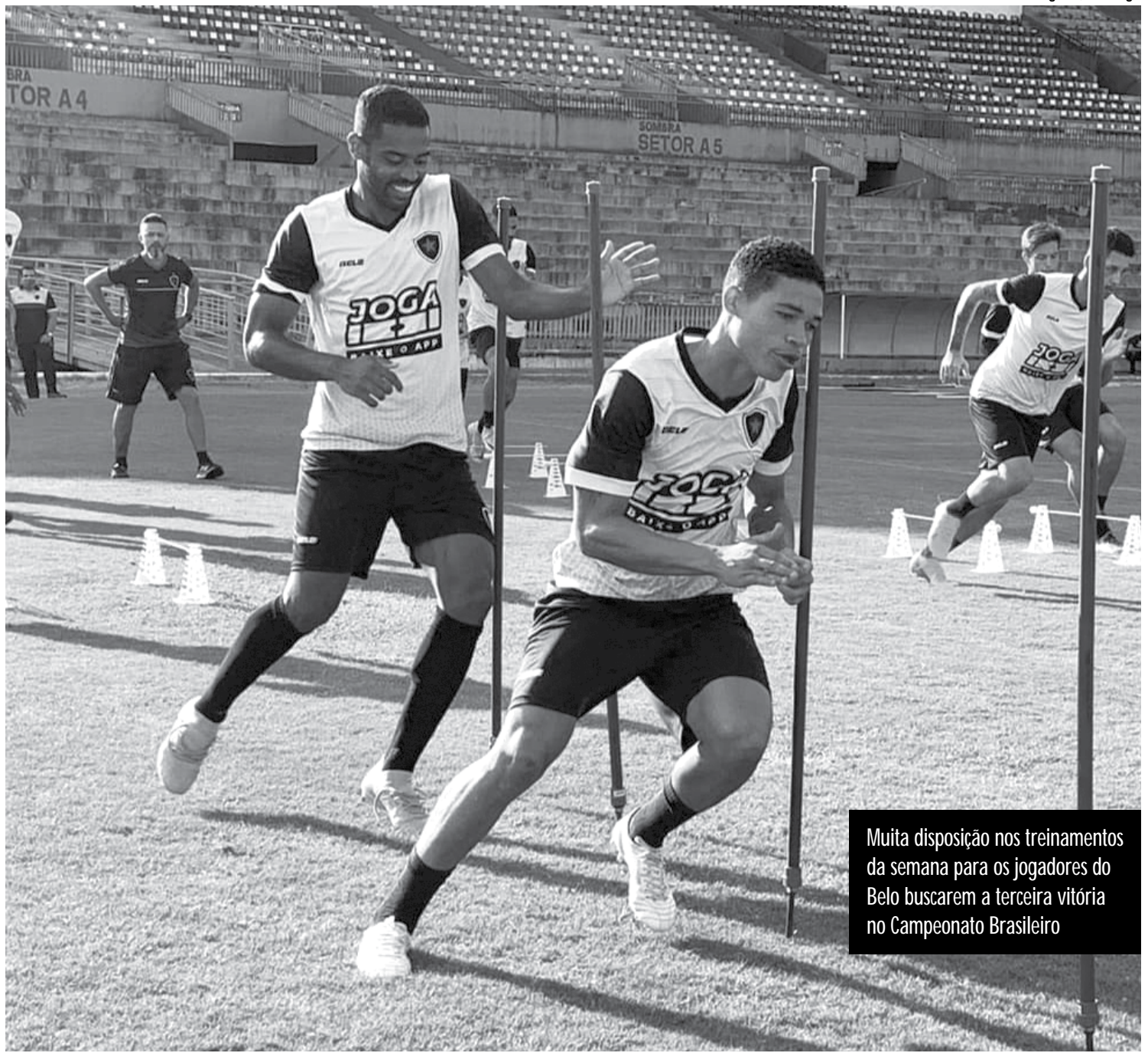
Muita disposição nos treinamentos da semana para os jogadores do Belo buscarem a terceira vitória no Campeonato Brasileiro

O Imperatriz vem de uma goleada em casa por 6 a 1 para o Santa Cruz e joga agora apenas para cumprir tabela, porque já está virtualmente rebaixado para a Série D. Com dívidas junto à Fifa, o clube relacionou 21 jogadores para a partida, mas só poderá utilizar 16, porque está proibido de registrar atletas no momento.