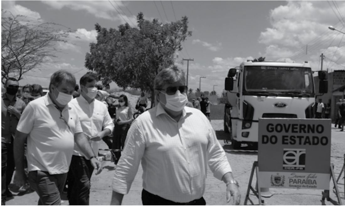
Em Sousa, investimentos realizados pelo Estado somam R$ 32 milhões, informou o governador João Azevêdo

O gestor ainda fez um balanço das obras do Governo no município que somam mais de R$ 32 milhões em investimentos. "Existe um conjunto de obras que estão sendo executadas em Sousa. Na Escola Antônio Teodoro Neto temos um ginásio e uma quadra sendo feitos. Iniciamos o asfaltamento do bairro Angelim, contemplando várias vias na cidade. Nós também assinamos um ginásio na Escola Celso Mariz, estamos anunciando a obra da Perimetral Oeste, uma das ações mais importantes para a mobilidade urbana de Sousa, além de outras ações", acrescentou.