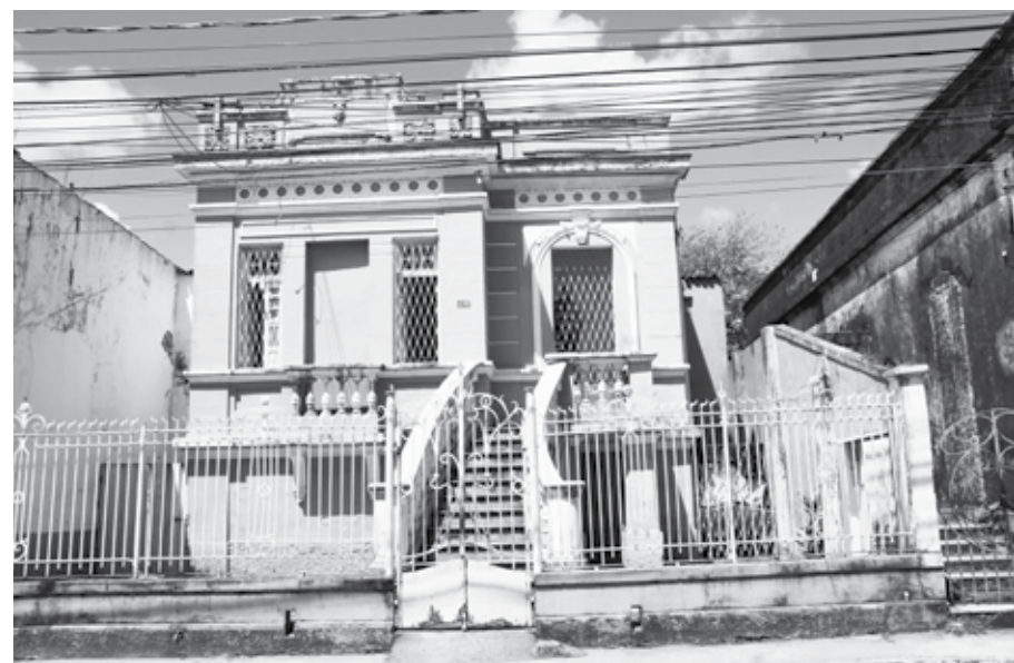
Belos casarões eram habitados por famílias abastadas, que escolhiam as Trincheiras para morar

“A expansão das atividades terciárias e a reestruturação do espaço urbano de João Pessoa condicionaram o deslocamento residencial de boa parte da população em direção à Zona Leste, no sentido da Avenida Epitácio Pessoa. Outro fator que propiciou a desconcentração de atividades no Centro da