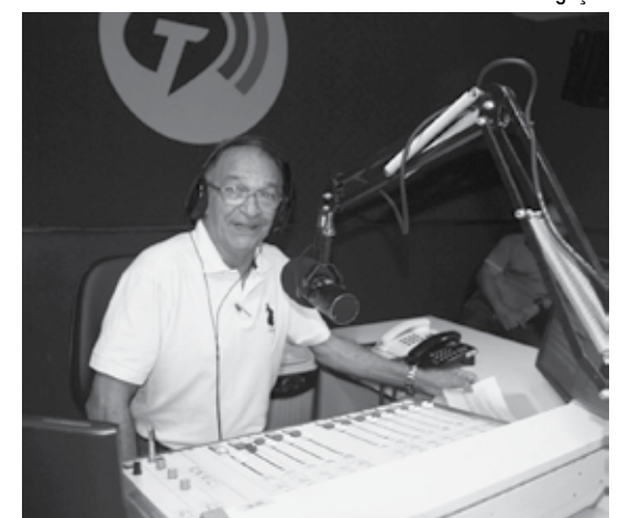
Eudes Toscano, um dos maiores nomes do rádio esportivo