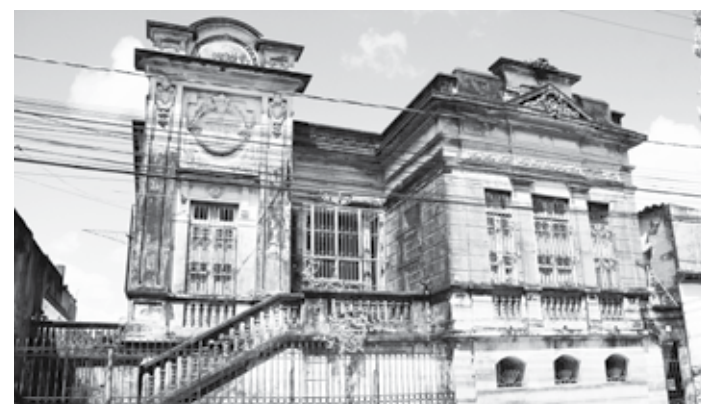
Equipamentos públicos, como igrejas, valorizaram ainda mais o bairro no início do século 20; hoje, as Trincheiras são sinônimo de abandono